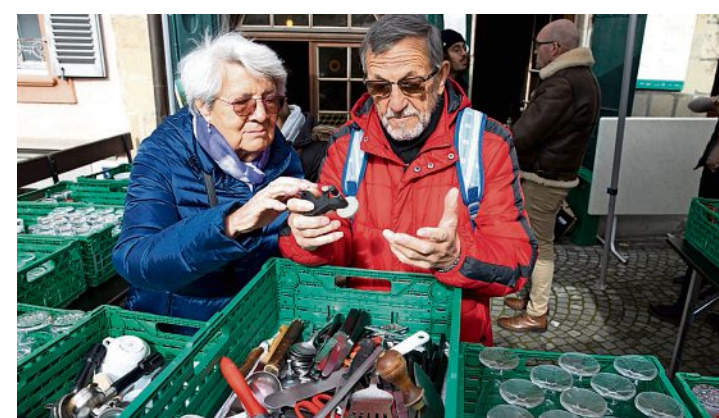
Anciens habitués et simples passants ont chiné sur la terrasse et dans l'établissement.